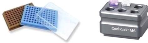
단점 투성이인 유전자 실험 제품들