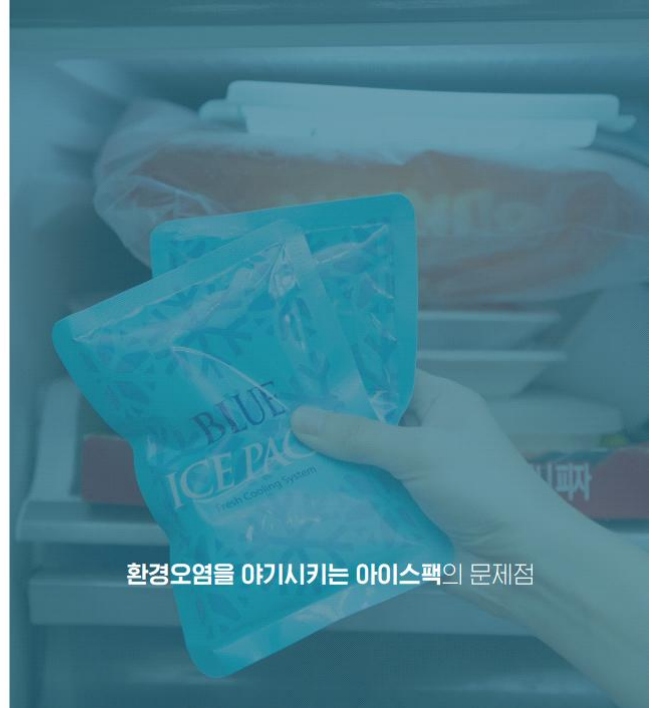
환경오염을 야기시키는 아이스팩의 문제점