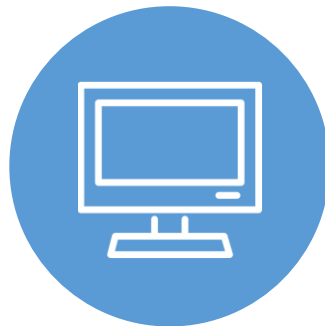
데모 장비 시연